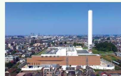
練馬清掃工場 (都市ごみ発電プラント)

JFEグループの技術は、皆様の生活を支える道路やごみ処理などの社会インフラの分野にも活かされています。このような技術を通じて、皆様のくらしを下支えすると同時に、環境負荷の低減にも貢献しています。