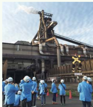
株主様工場見学会

適時・適切な会社情報の提供を重視し、即時性の高いウェブサイトを活用しているほか、決算発表の早期化に努めています。また、事業活動への理解を深めていただくため、工場見学会やIR説明会を開催しています。