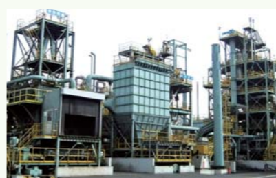
フェロコークス製造設備

世界最高の技術をもって、製品を製造する過程での環境負荷を低減するとともに、環境に配慮した製品やサービスを提供することで、温室効果ガス排出削減、資源循環や生物多様性保護など、環境保護に貢献しています。