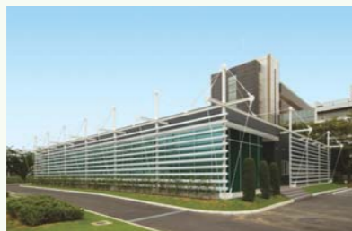
カスタマーズ・ソリューション・ラボ (CSL)

各種認証の取得やマネジメントシステムの整備に加え、お客様と一体となった商品開発施設を開設するなど、ニーズに基づく高品質な商品・サービスの提供を通じて、お客様の競争力向上に貢献します。