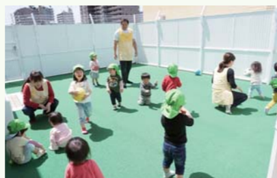
事業所内保育所で過ごす児童

多様な人材が活力を持って働ける環境を目指し、ワーク・ライフ・バランスの推進や両立支援制度の整備、安全で働きがいのある職場の実現、一人ひとりの能力向上と技能伝承、健全な労使関係の継続などに取り組んでいます。