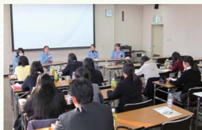
高校生のキャリア教育受け入れ

地域社会の発展に貢献するため、製造拠点を開放してのイベントや出前授業などを実施しています。また大学研究助成や国内外の青少年育成支援に積極的に取り組むなど、様々な社会貢献活動を継続的に実施しています。