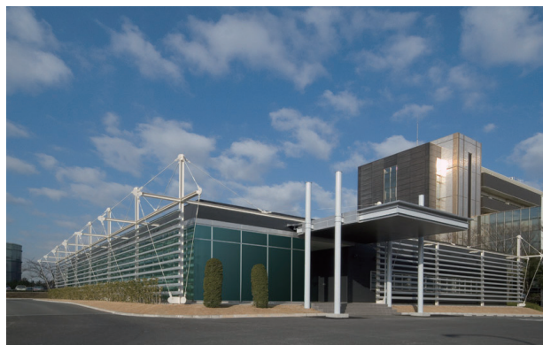
カスタマーズ・ソリューション・ラボ

※ Early Vendor Involvementの略。お客様の新商品開発に初期段階から参画し、その新商品のコンセプトに合わせた鋼材使用、部材加工方法、パフォーマンス評価などを提案・開発する活動