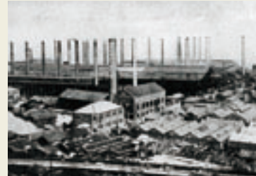
1930年当時の葺合工場