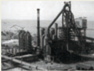
千葉製鉄所第1高炉