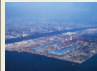
建設直後の扇島(手前)