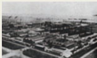
1940年当時の工場全景