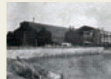
1949年当時の知多工場