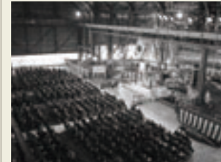
水島製鉄所第1高炉火入れ式