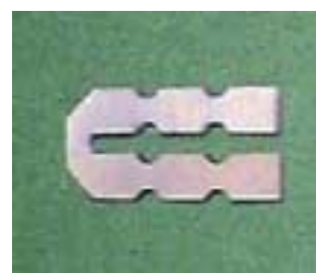
当社開発材料から試作した熱電変換素子