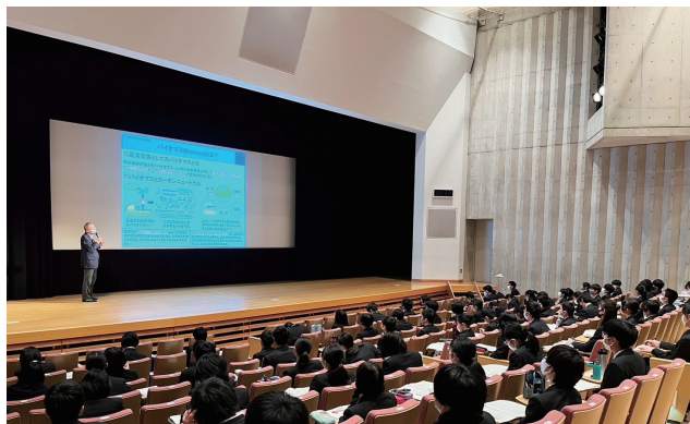
横浜サイエンスフロンティア高等学校附属中学校での講演