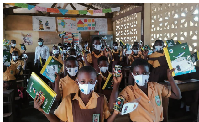
ガーナの小学校の皆さん

本支援は、JFE 商事グループの象徴的な活動として位置付け、今後も「食」と「教育」の支援を続けていきます。