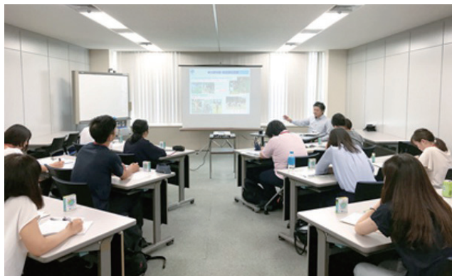
教員の民間企業研修

JFE商事グループの川商フーズは、NPO法人学校サポートセンターと連携し、中高生向けキャリア教育として仕事の社会的役割や製品・サービスの特徴などについて理解を深めてもらう研修を企画し、受け入れを行っています。