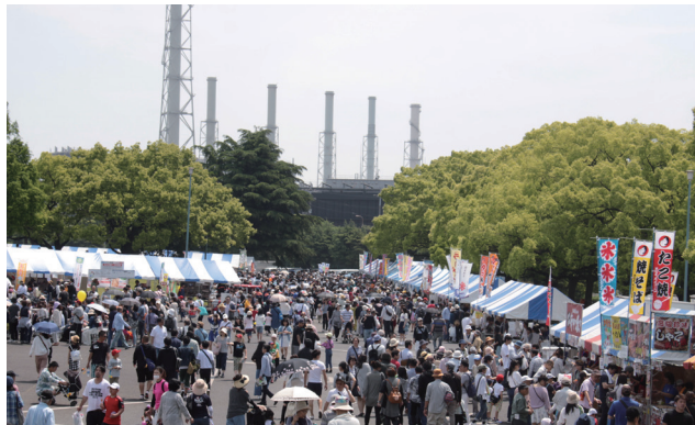
JFE西日本フェスタinふくやま

また、各社の福利厚生施設を地域に開放して、サッカー、野球、バレーボール、バスケットボールなどのスポーツ大会を開催するほか、全国レベルで活躍している硬式野球部と競走部による指導教室なども開催しており、それぞれの地域におけるスポーツの振興と発展に寄与しています。