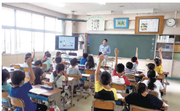
寒川小学校(千葉県千葉市)での出前授業

JFEスチールでは、地域貢献活動の一環として、近隣の小学生や中学生を対象として、工場見学のほか、従業員が学校を訪問し、鉄の製造プロセスや製鉄所の特徴、環境への取り組みなどを解説して鉄鋼業への理解を深めてもらったり、キャリアへの理解を深めてもらう出前授業を実施しています。この取り組みは2012年度から開始し、2022年度は397人(39クラス)の子どもたちを対象に実施しました(累計では約309クラスに実施)。2017年度には初めて聾学校でも実施しました。